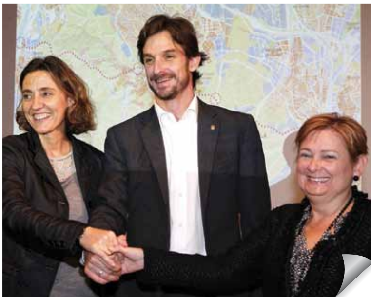
Mercè Conesa, Xavi Paz i Carme Carmona, a l'acte de la desprogramació del Vial de Cornisa.

L'alcalde de Molins de Rei, Xavi Paz; l'alcaldesa de Sant Cugat, Mercè Conesa, i l'alcaldesa de Cerdanyola, Carme Carmona, van presentar, el passat 25 d'octubre, a la sala Gòtica, l'acord dels tres municipis per impulsar de manera conjunta la desprogramació del vial de Cornisa