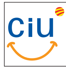
Joaquim Martí Convergència i Unió

Amb la inauguració de la nova plaça verda del Palau, també hem guanyat, a més d'un espai per al gaudi en ple centre de la vila, de manera que es compleix una altra de les nostres promeses electorals, un nou espai on celebrar amb tota dignitat i solemnitat els actes de la nostra Diada amb el monument a Rafael Casanova que hi ha col·locat.