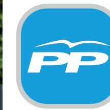
Emilio Ramos Gutiérrez Partit Popular de Catalunya

A l'hora de tancar aquesta edició el grup municipal del Partit Popular no ha fet arribar cap escrit per ser publicat en aquest espai.