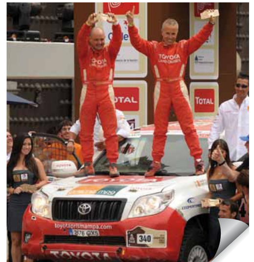
Equip Toyota Prima MPA Team

El pilot de Toyota rebrà un homenatge públic el proper 25 d febrer a les 12.30h en què s'exhibirà el cotxe guanyador a la Plaça de la Vila