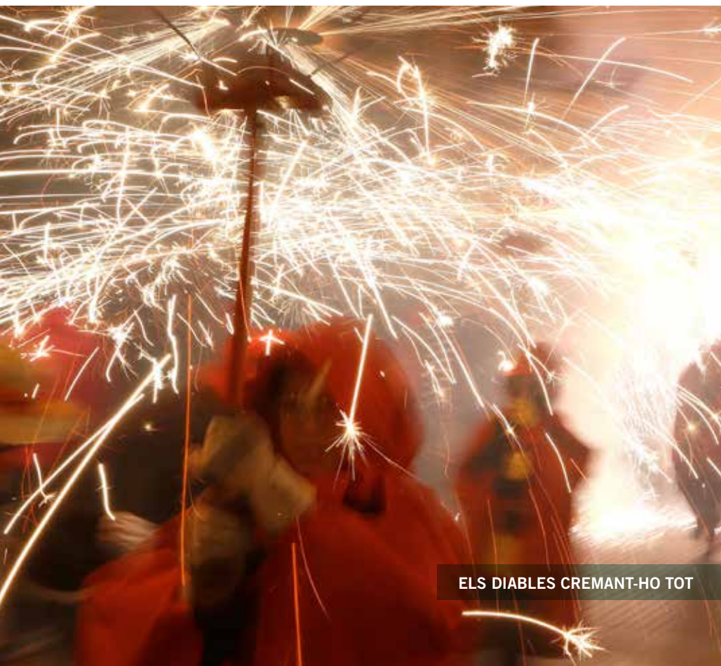
ELS DIABLES CREMANT-HO TOT