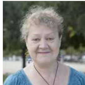
ROSA VERGÉS Arts gràfiques

Em sembla molt bé, sobretot ara que ja no cal baixar gairebé fins al barri del Canal per accedir a la zona del riu. Ara és una delícia, sobretot per anar a passejar el gos.