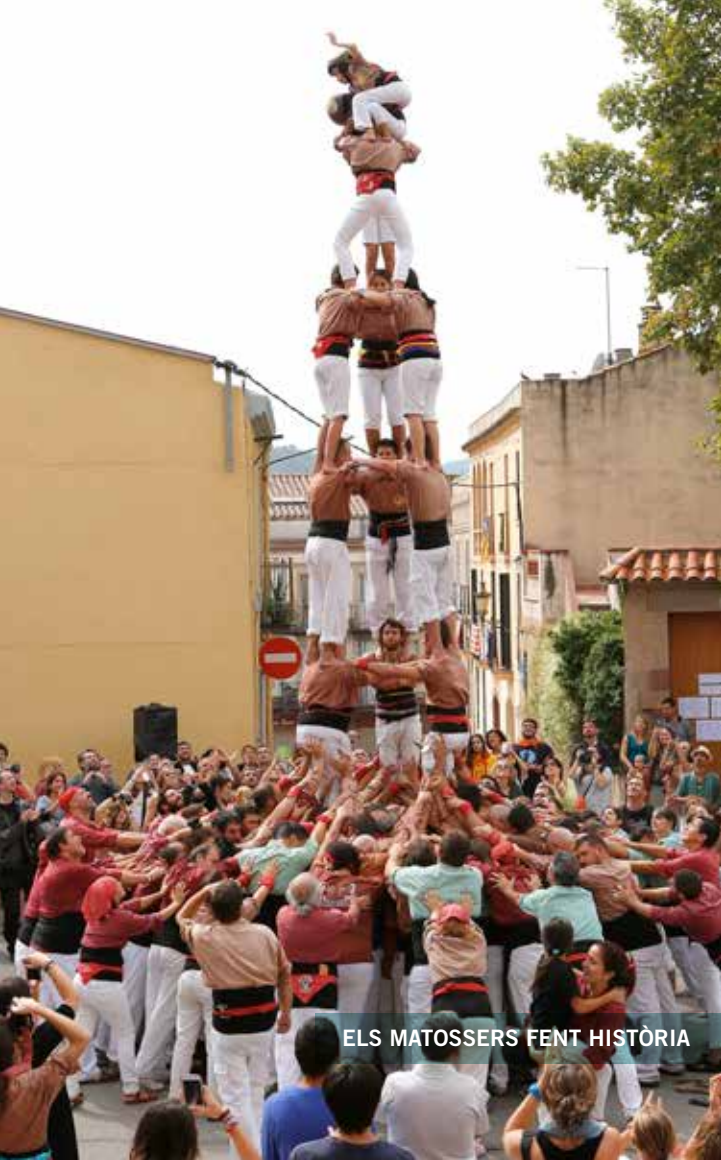
ELS MATOSSERS FENT HISTÒRIA