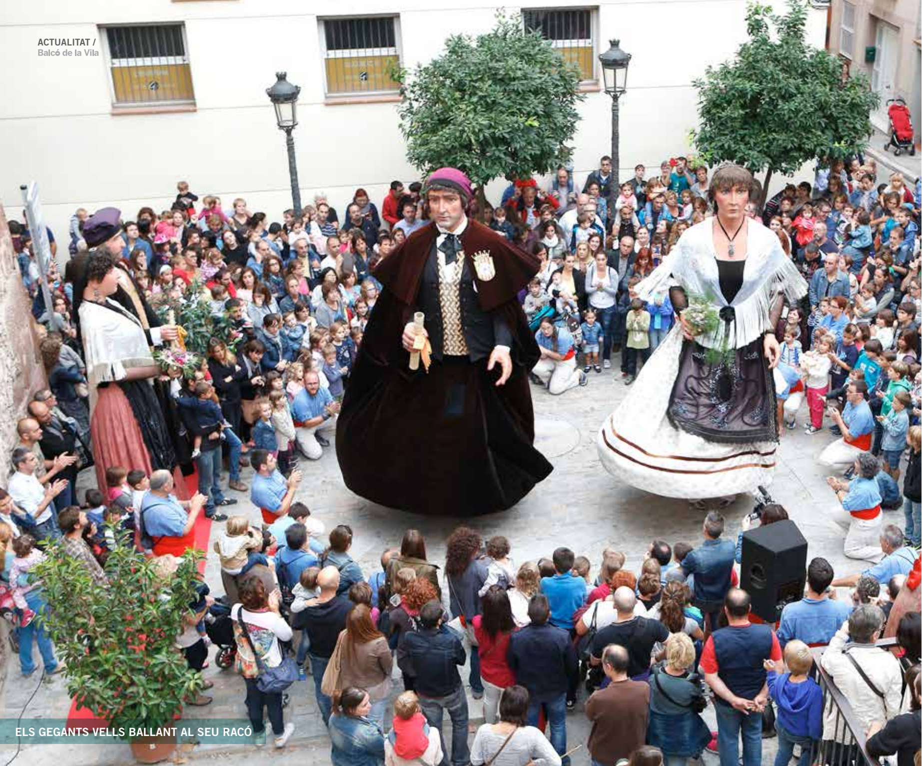
ELS GEGANTS VELLS BALLANT AL SEU RACÓ