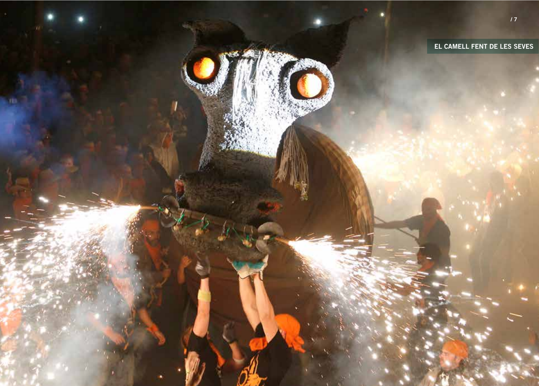
EL CAMELL FENT DE LES SEVES