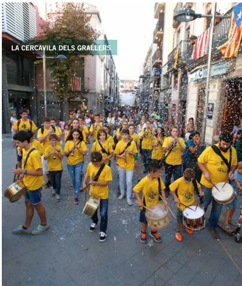
LA CERCAVILA DELS GRALLERS