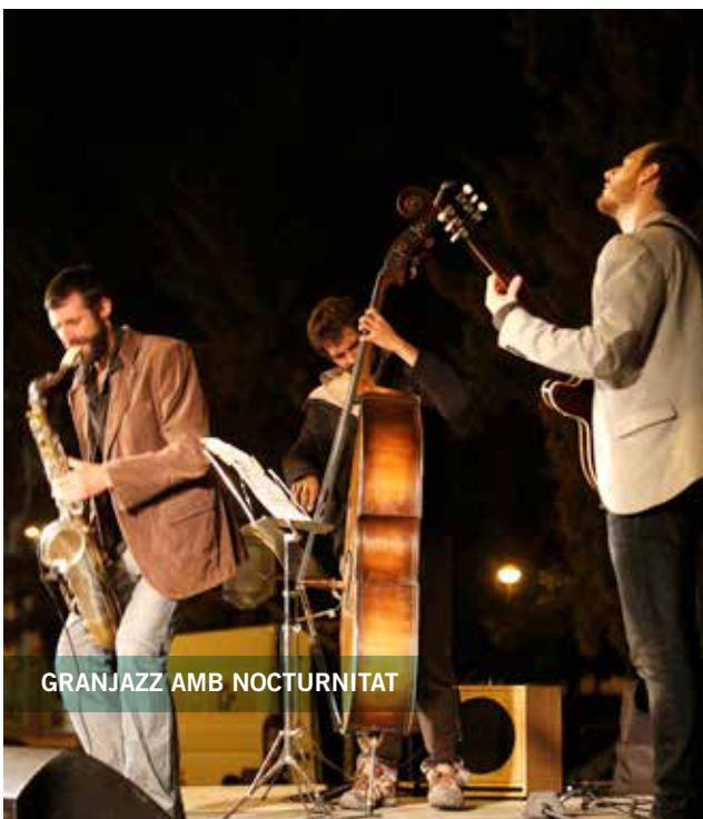
GRANJAZZ AMB NOCTURNITAT