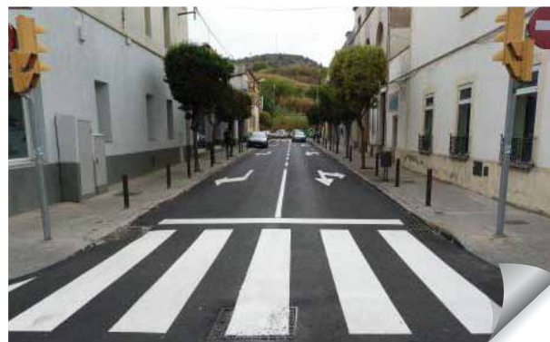
C/ Juli Garreta

També s'han resolt els problemes d'humitat del carrer Balmes gràcies a la instal·lació d'un tub de drenatge per tal d'interceptar les aigües d'escorrentia que discorrien per sota del paviment i que provocaven afectacions a les finques.