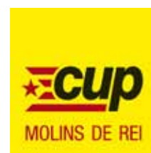
Roger Castillo i Bosch Candidatura d'Unitat Popular