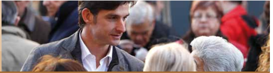
Xavi Paz L'alcalde