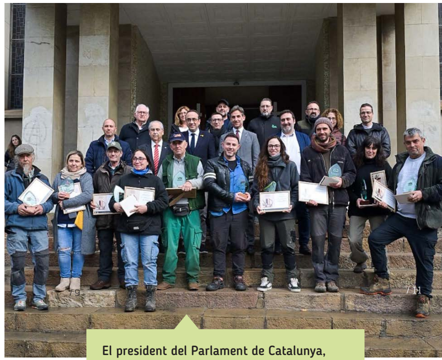
El president del Parlament de Catalunya, Josep Rull, va visitar el recinte firal i va ser present a l'entrega de premis del planter.