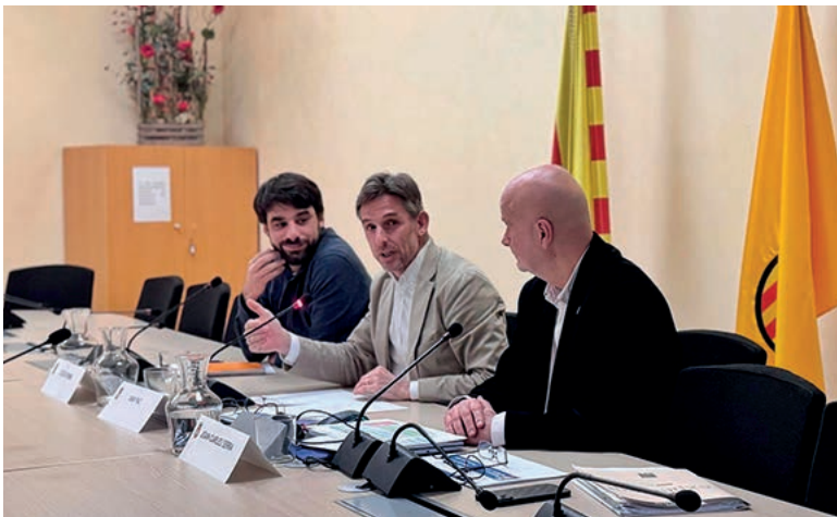
Presentació del Pressupost 2025