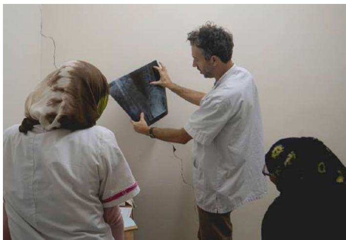
El traumatòleg fent formació als campaments sahrauís.

El principal repte va ser començar a fer docència i assistència en un context en què no s'havia fet, pel que fa a la traumatologia. A més, no sabia quines serien les demandes de la població, i quin seria el material mèdic amb el qual comptaria.